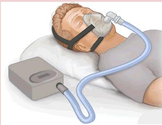
上圖為非侵襲性呼吸器面罩